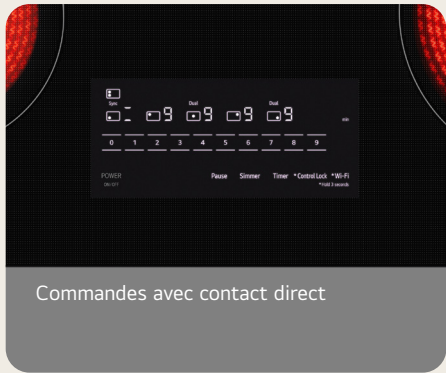
Commandes avec contact direct