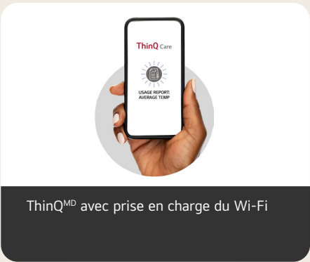
ThinQ MD avec prise en charge du Wi-Fi