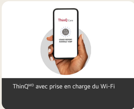
ThinQ MD avec prise en charge du Wi-Fi