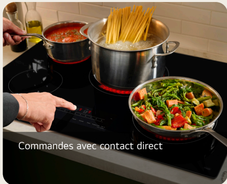
Commandes avec contact direct