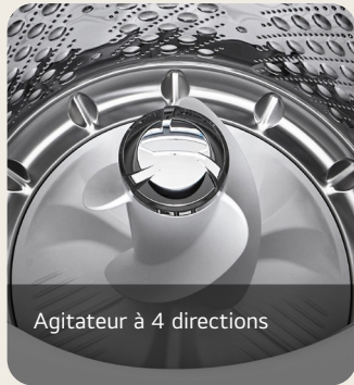
Agitateur à 4 directions