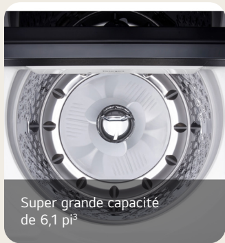
Super grande capacité de 6,1 pi 3

Laveuse à chargement vertical de 6,1 pi 3 avec agitateur à 4 directions, fonctionnalité EasyUnload MC et détection par IA