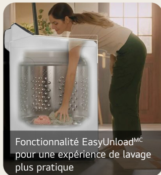
Fonctionnalité EasyUnload MC pour une expérience de lavage plus pratique