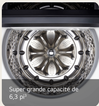
Super grande capacité de 6,3 pi 3

Laveuse à chargement vertical de 6,3 pi 3 avec fonctionnalité EasyUnload MC et détection par IA