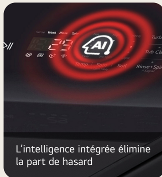
L'intelligence intégrée élimine la part de hasard