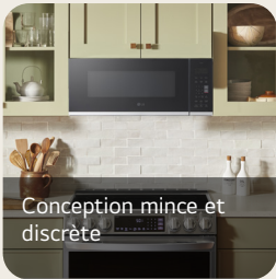
Conception mince et discrète