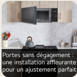
Portes sans dégagement : une installation affleurante pour un ajustement parfait