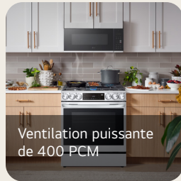
Ventilation puissante de 400 PCM