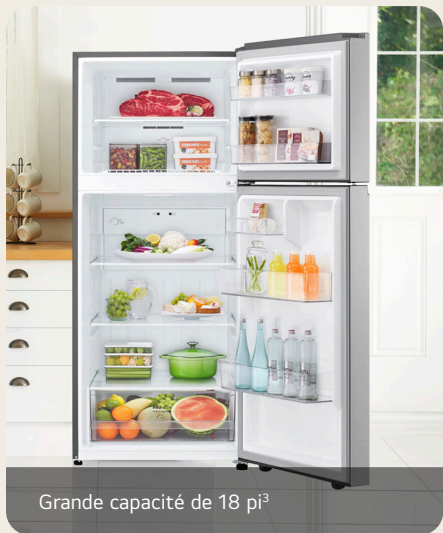
Grande capacité de 18 pi 3

Réfrigérateur de 28 po d'une capacité de 18 pi 3 avec congélateur en haut