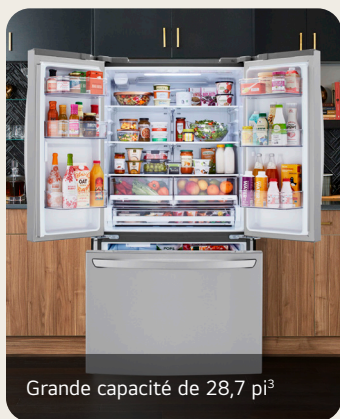
Grande capacité de 28,7 pi 3

Réfrigérateur de 36 po d'une capacité de 28,7 pi 3 avec porte à deux battants