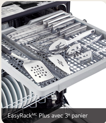
EasyRack MC Plus avec 3 e panier